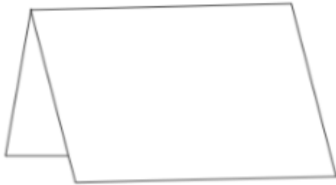
A. Plie une feuille de papier un peu épais en deux.